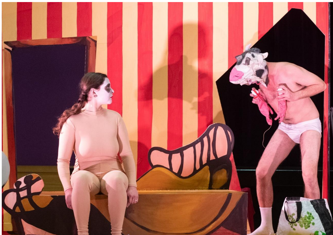
Eric Chauvet 2024

D'après la nouvelle La Vache de Thomas Gunzig (avec l'aimable autorisation des éditions Au diable vauvert)